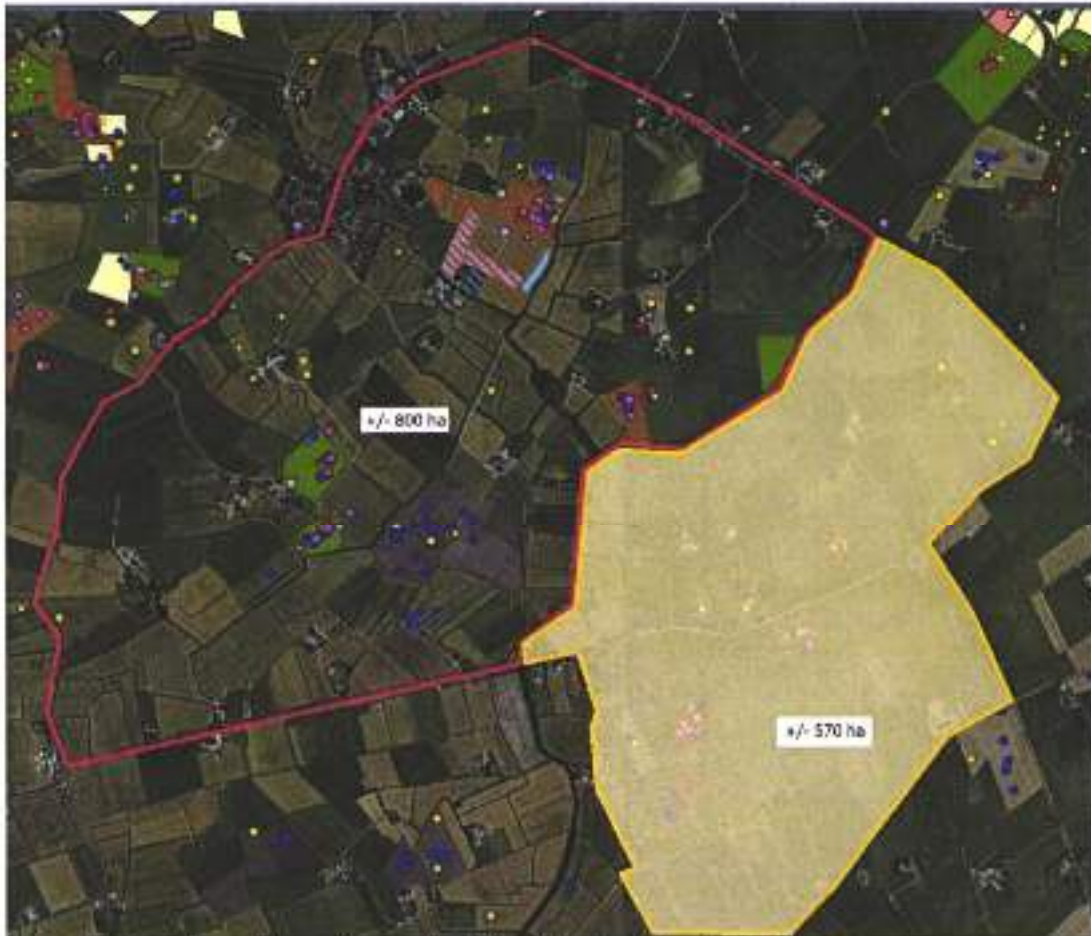
Figuur 3. Uitbreiding weidevogelbeheer in 2025, i.h.k.v. Aanvalsplan Grutto.

Daarnaast zijn er plannen om ten noorden van de huidige 34 hectare grote kern nog eens ca. 10 hectare extra weidevogelbeheer te realiseren.